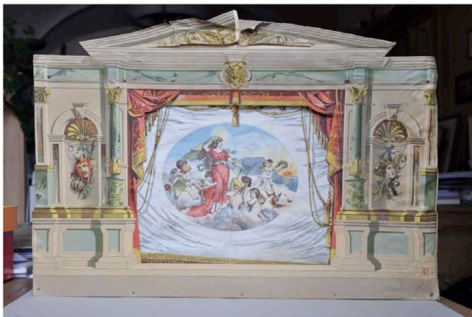
„Schreibers zusammenlegbares und zusammenklappbares Kindertheater“ Esslingen a. N. um 1895, bedrucktes Papier auf Holzstruktur, 49x69x43 cm Das Kinderspieltheater befand sich im alten Engadiner Haus Froriep-von Salis in La Punt

Kulturarchiv Oberengadin, Chesa Planta, 7503 Samedan Tel. 081 852 35 31, Fax 081 852 15 33, E-Mail: kulturarchiv@bluewin.ch Homepage: www.kulturarchiv.ch